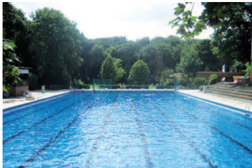
Ausreichend Platz beim Schwimmen ist garantiert